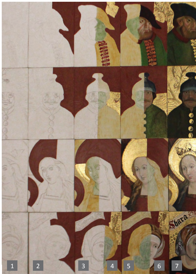
Študije detajlov slike Sv. sorodstvo