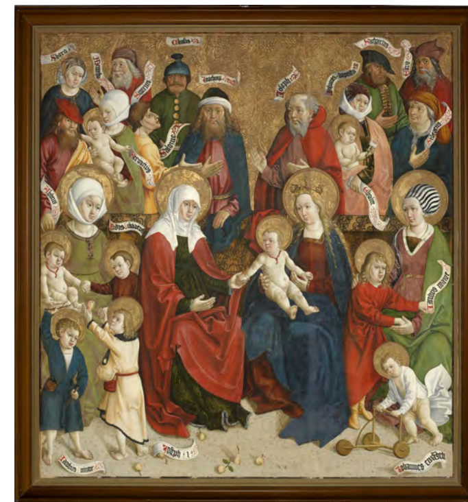
Mojster iz Okoličnega (?), Sveto sorodstvo , po 1510, olje, les, 150 × 121 cm, inv. št. N 1528, Narodni muzej Slovenije

4. junij – 4. julij 2014 Narodni muzej Slovenije – Metelkova Maistrova ulica 1, 1000 Ljubljana